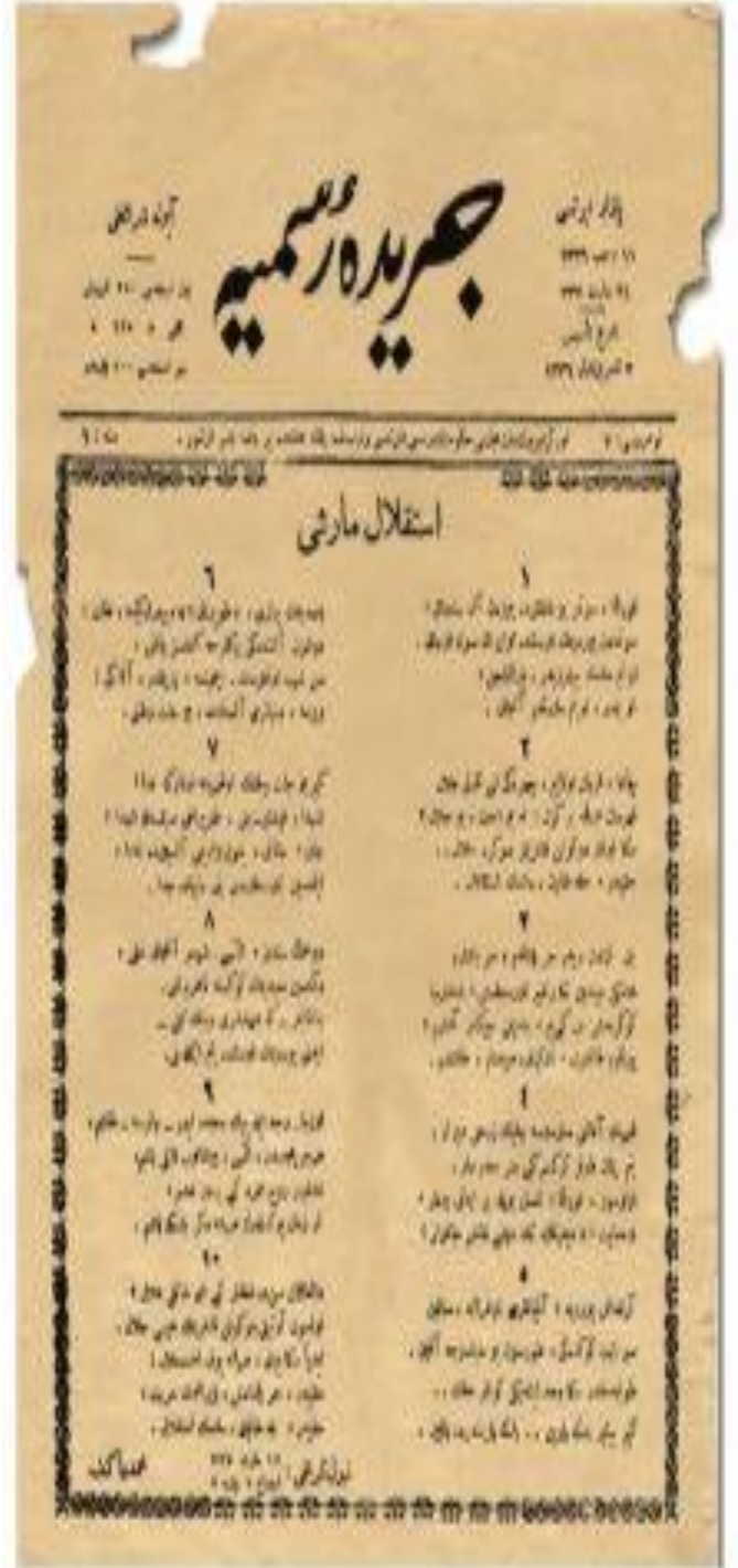
Görselde; 21 Mart 1921 Tarihli Resmi Gazete'nin ilk sayfasında yer alan İstiklal Marşımız.