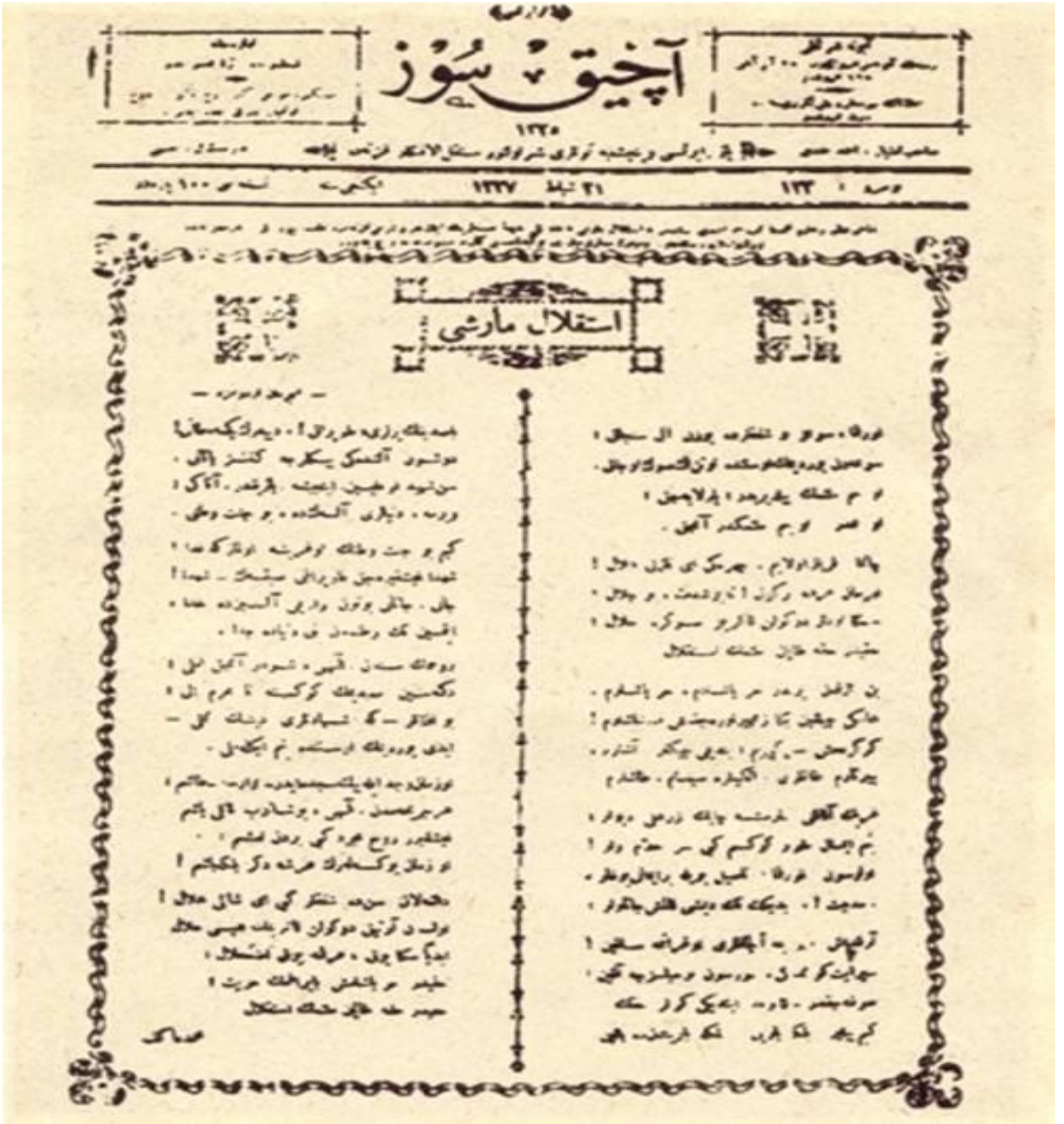
Görsel: Açık Söz Gazetesi'nde İstiklâl Marşı'mız.

“HAKKIDIR, HÜR YAŞAMIŞ BAYRAĞIMIN HÜRRİYET; HAKKIDIR HAKKA TAPAN MİLLETİMİN İSTİKLAL!..”